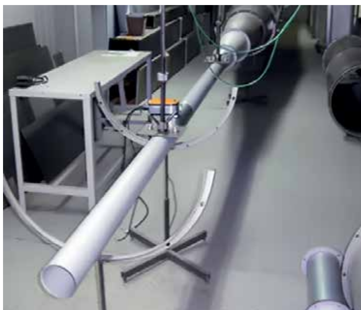
Стенд для проведения аэродинамических испытаний

Внимание! Для изготавливаемых противопожарных клапанов и решеток РКДМ с пониженным аэродинамическим сопротивлением разработаны базы данных для Revit и MagiCad.