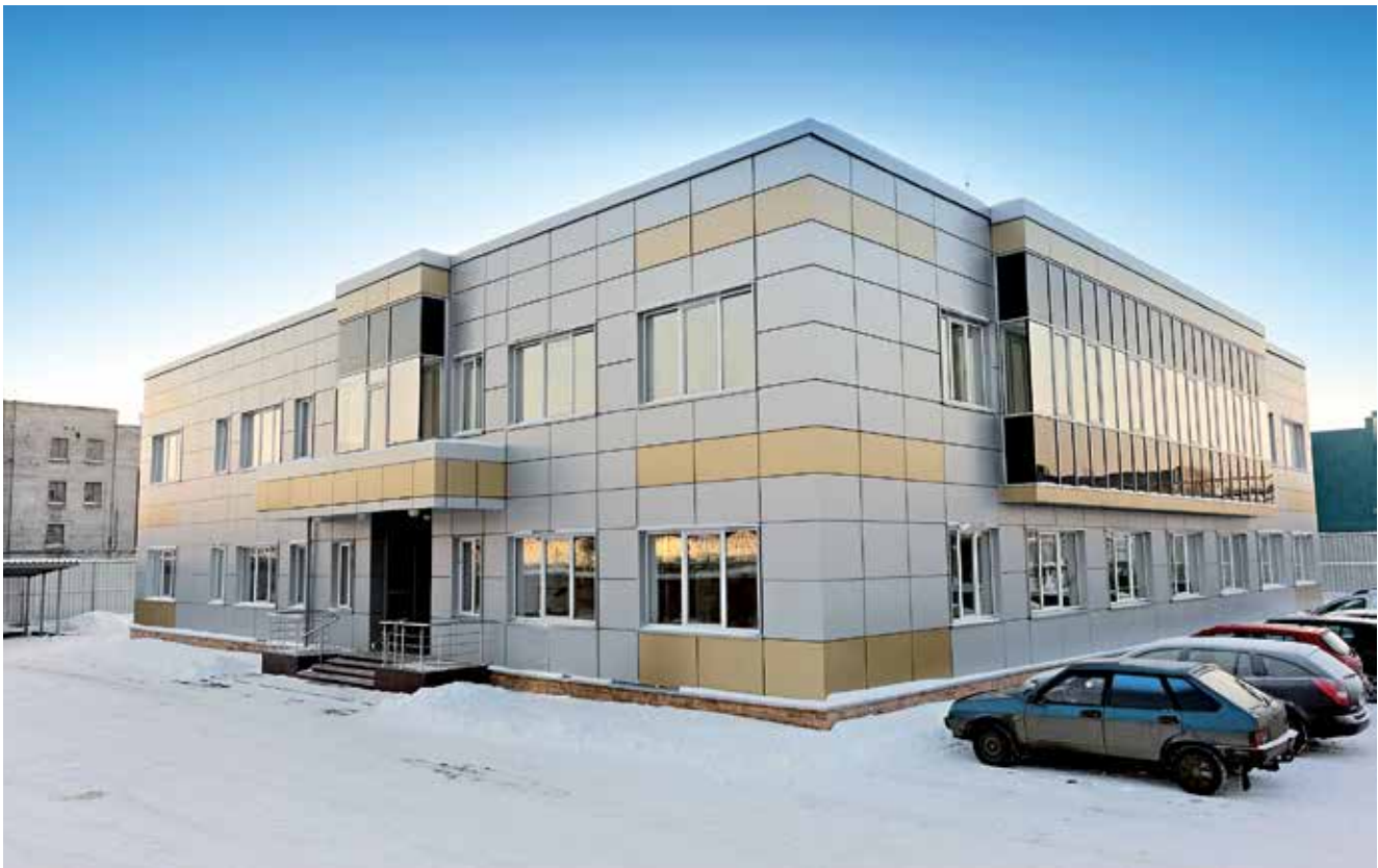
Центральный офис ЗАО «ВИНГС-М», г.Балашиха Московской области

ЗАО «ВИНГС-М» является постоянным участником многочисленных московских, региональных и международных выставок. Фирма неоднократно награждалась дипломами, медалями и кубками за лучшие технические решения, активное внедрение современных технологий и новаторских идей в практическую деятельность.